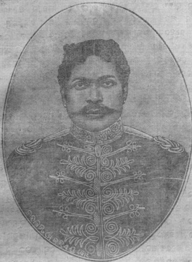
ଉତ୍କଳ ସମ୍ମିଳନର ଦ୍ଵିତୀୟ ଅଧିବେଶନର ସଭାପତି ଶ୍ରୀମତୀ ଶ୍ରୀମତୀ ଶ୍ରୀମତୀ ଶ୍ରୀମତୀ ଶ୍ରୀମତୀ ଶ୍ରୀମତୀ

ଉତ୍କଳ ସମ୍ମିଳନର ଦ୍ଵିତୀୟ ଅଧିବେଶନର କବଳର ପ୍ରକାଶ କରଣା ସମ୍ପାଦନା ପ୍ରଧାନ କାର୍ଯ୍ୟ ଦେବାକୁ ଏକ ତାରିଖ ଏଥରର ସମସ୍ତ ପ୍ରାଚ ଅଧିକାର କରଣକୁ ଅନ୍ୟତମ ପ୍ରସଙ୍ଗ ଏ ସମ୍ପ୍ରାଦେୟ ସୁବଳ ଉପକାଳୁ ନାହିଁ ହୋଇଅଛି ।